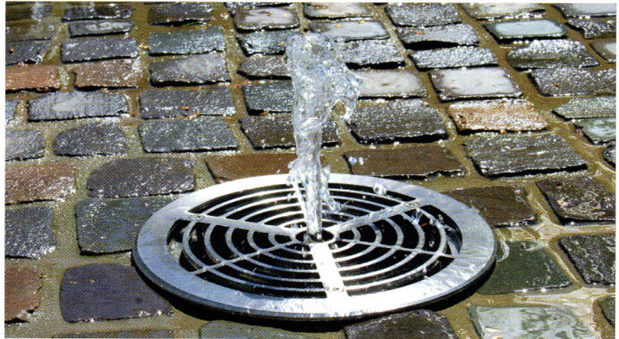
Wasserspiel: Trinkwassertrennstationen sind zwingend vorgeschrieben, wenn durch den Verwendungszweck eine Verkeimung des Trinkwassers über die Entnahmestelle befürchtet werden muss.

Die Diskussion um Schutz und Hygiene des Trinkwassers hat unter anderem dazu geführt, dass die Normen zum Absichern gegen Rückfließen und Rückverkeimung weiter konkretisiert und verschärft wurden. Da die Trinkwasser-Installationen nach den Wasserzählern in der Verantwortung der Hausanschlussnehmer liegen, sind alle Betreiber von Trinkwasseranlagen – kommunal oder gewerblich beziehungsweise industriell und auch privat – in der Pflicht, die gesetzlichen Vorgaben und Normen zu erfüllen.